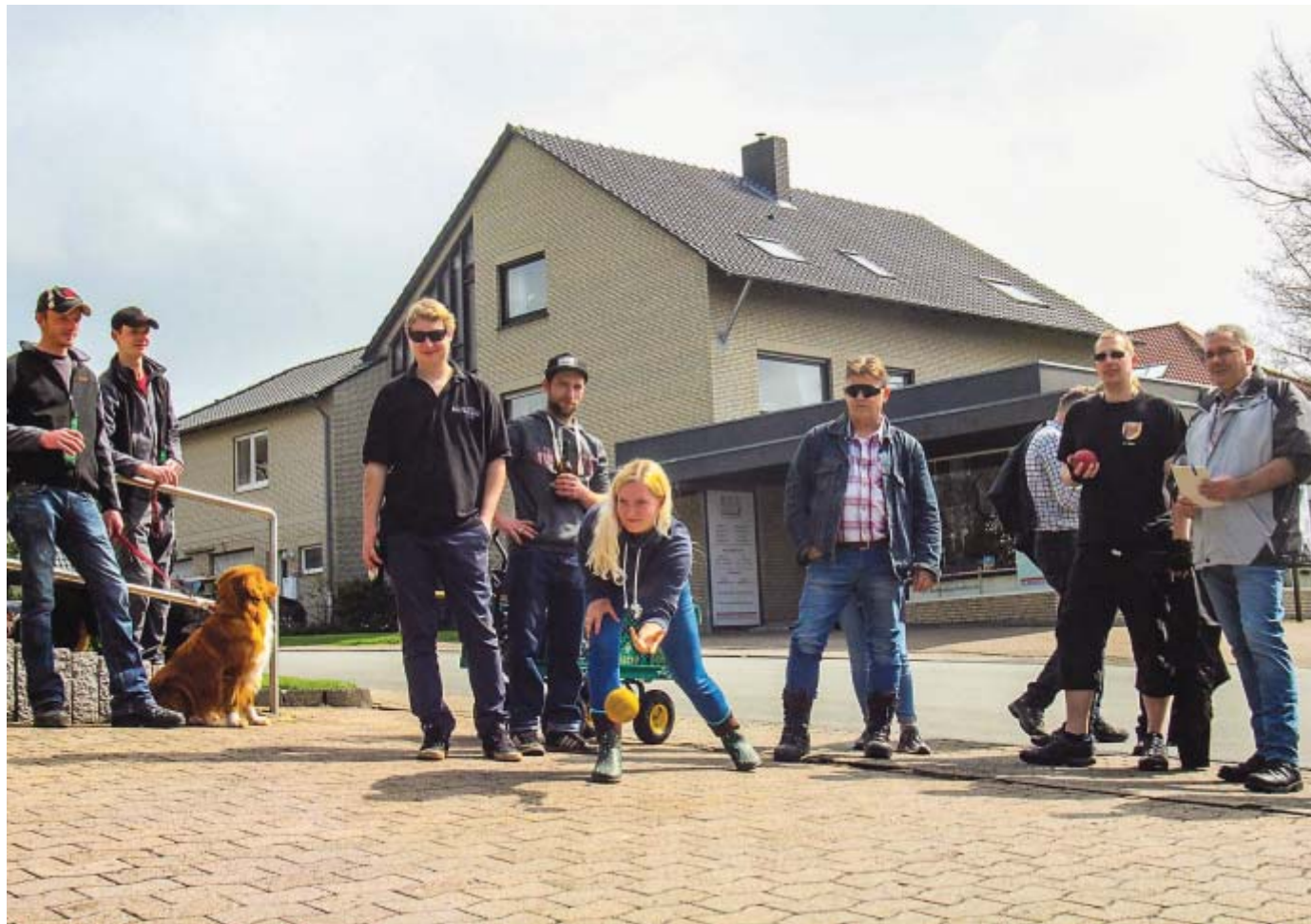
Wichtigste Boßelregeln: Möglichst wenige Würfe und möglichst viel Spaß.