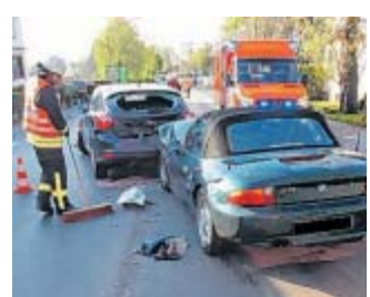
Rund 10.000 Euro Schaden: Ein BMW prallte gegen einen Ford.

Durch die Wucht des Aufpralls wurden der Hüllhorster und die BMW-Fahrerin leicht verletzt. Beide Personen wurden vom Rettungsdienst versorgt und ins Krankenhaus nach Lübbecke gebracht. Um die Beseitigung ausgetauener Betriebsstoffe kümmerte sich die Feuerwehr. Während der Unfallaufnahme und Säuberung der Fahrbahn wurde der Verkehr einseitig an der Einsatzstelle vorbeigeführt. Beide Autos mussten abgeschleppt werden.